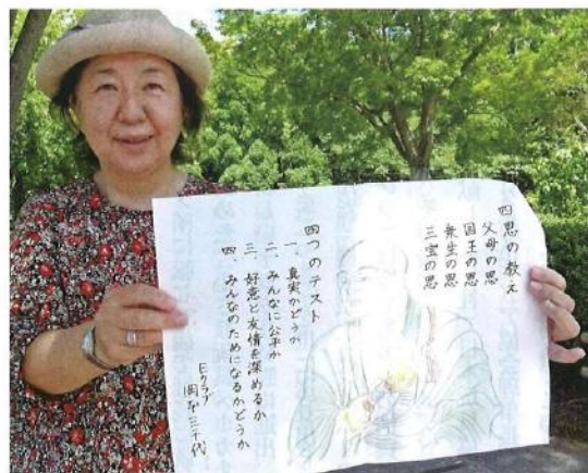
空海と、「四恩の教え」「四つのテスト」。絵写経を実践しました